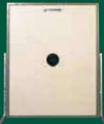
Elektronische Scheibenanlage 300 m ESA 300