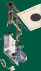
Scheibentransport- anlage 25/50/100 m Als Match und Turnier