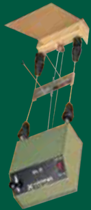
Scheibenzuganlage 10 m EL 3