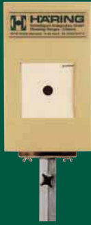
Elektronische Scheibenanlage 10 m ESA 10