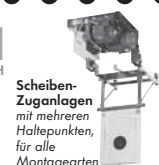
Scheiben- Zuganlagen mit mehreren Haltepunkten, für alle Montagearten

Postfach 1140 · D-35086 Battenberg Tel. (0 64 52) 93 32-0 · Fax: (0 64 52) 93 32-163 E-mail: info@johannsen.de Internet: www.johannsen.de