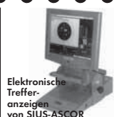
Elektronische Treffer- anzeigen von SIUS-ASCOR

Ein Begriff für perfekte Schießstand- technik