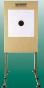
Elektronische Scheibenanlage 25/50/100 m ESA 25 ESA 50 und ESA 100