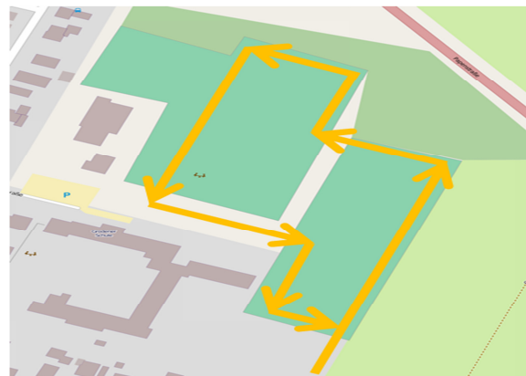
Gelbe Runde (ca. 800 m):